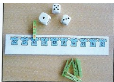
5 et 3 pour faire 8.