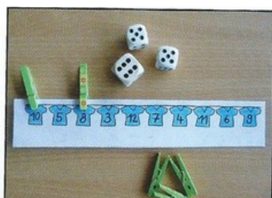
5 et 5 pour faire 10.